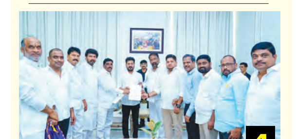
సీఎం రేపంత్ రెడ్డిని కలిసి వినతి పత్రం సమర్పిస్తున్న మంత్రి