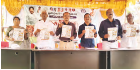
పశువైద్య కరవైద్యులు విడుదల చేస్తున్న అధికారులు

గ్రామీణ కుటుంబాలకు జీవనోపాధి కల్పించడంలో కీలక పాత్ర పోషిస్తోందన్నారు. రైతులు దూడల సంరక్షణలో శాస్త్రీయ యాజమాన్య వద్దతులు పొందించడంతో పాటు పశుగ్రాస వంటల సాగుపై దృష్టి సారించాలని సూచించారు. వేసవి కాలంలో పశువుల సంరక్షణపై ప్రత్యేక శ్రద్ధ వహించాలని తెలిపారు. జిల్లా పశువైద్యాధికారి డా. బి. ఈశ్వర్ రెడ్డి మాట్లాడుతూ జిల్లాలో అనేక మంది రైతులు గోరైల పెంపకంపై ఆధారపడి జీవనం కొనసాగిస్తున్నారని తెలిపారు. ప్రభుత్వ పథకాలను సద్వినియోగం చేసుకొని పాడిపశువుల పెంపకంపైనా రైతులు ఆసక్తి చూపాలని సూచించారు. పాడి రైతుల సౌకర్యార్థం జిల్లా కేంద్రంలో