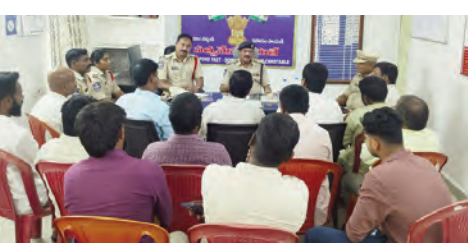
సమావేశంలో మాట్లాడుతున్న డి.ఎస్సీ