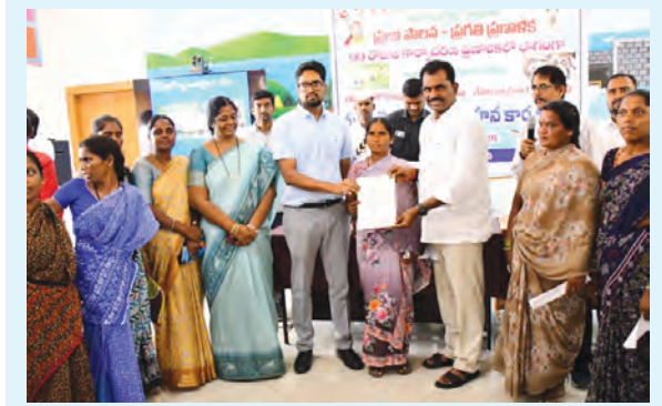
మత్స్యకార రైతులకు అవగాహన కార్యక్రమంలో, ఎమ్మెల్యే కలెక్టర్