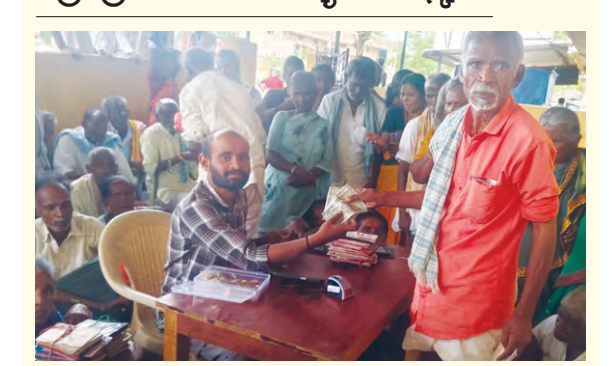
వృద్ధులకు పంచన పంపిణీ అధికారులు

ధన్వాడ, మే 8 ప్రభాతవార్త: ధన్వాడ మండల కేంద్రంలో ఏప్రిల్ నెలకు సంబంధించిన పంచన పంపిణీ తీవ్ర ఆలస్యానికి గురైన విషయం తెలిసింది. ప్రభుత్వం నిధులు మంజూరు చేసినప్పటికీ బ్యాంకులో డబ్బులు కొరత కారణంగా లబ్ధిదారులు రోజులు తరలడి ఇబ్బందులు ఎదుర్కొన్నారు. పంచన పంపిణీ కోసం ప్రతిరోజూ ధోన్య ఆఫీస్ చుట్టూ తిరుగుతూ గంటల కొద్దీ ఎదురు చూసిన వృద్ధులు, వికలాంగులు, వితంతువులు వివరణ ఆందోళనకు దిగారు. ఈ సమస్యను వారాపత్రిక వరస కథనాల ద్వారా ప్రజల - మిగతా4లో..