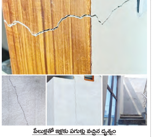
పేలుళ్లతో ఇళ్లకు పగుళ్లు వచ్చిన దృశ్యం

బాలానగర్, మే 8 ప్రభాతవార్త: బాలానగర్ మండల కేంద్రం శివారులో గురువారం రాత్రి 8 గంటల సమయంలో క్రమంలో జరిగిన భారీ పేలుడు శబ్దంతో మండల కేంద్రం ఒక్కసారిగా ఉలిక్కిపడింది. భూకంపం వచ్చినట్లుగా భారీ శబ్దాలు వినిపించడంతో ప్రజలు భయాందోళనకు గురయ్యారు. బ్యాంకింగ్ తీవ్రత కోసిన ఇండ్లు కంపించినట్లు స్థానికులు తెలిపారు. ఇప్పటికే పలు చోట్ల ఇండ్ల గోడలకు పగుళ్లు వచ్చాయని రోజుకోఒకూ పరిశీలి అందోళనకరంగా మూలతోందని వాపోయారు. గౌతమ్పూర్, అమ్మపల్లి, బాలానగర్ గ్రామాలకు సమీపంలో ఈ క్రవర్ణం ఉండడం వలన శబ్దాలు వ్యవధిలో పాటు వాయు కాలుష్యం - మిగతా4లో..