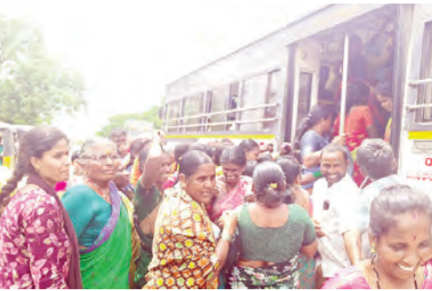
ఇబ్బందులు పడుతున్న మహిళా ప్రయాణికులు

ధన్వాడ, మే 8 ప్రభాతవార్త : నారాయణపేట జిల్లాలో పెళ్లకొండ అధికంగా ఉండటంతో బస్సుల్లో ప్రయాణికుల రద్దీ గణనీయంగా పెరిగింది. మండల కేంద్రమైన ధన్వాడలో బస్సులు సరిపడా అందుబాటులో లేకపోవడంతో ప్రయాణికులు తీవ్ర ఇబ్బందులు ఎదుర్కొన్నారు. బస్సులు ఎక్కెందుకు జనాలు తోపులాటకు దిగిన దృశ్యాలు కనిపించాయి. ప్రత్యేకంగా ఉదయం, సాయంత్రం వెళ్లే రద్దీ మరింత అధికమవుతోంది. ఈ పరిస్థితుల్లో మహిళలు, వృద్ధులు చిన్నపిల్లలు ఎక్కువగా ఇబ్బందులు పడుతున్నారని స్థానికులు తెలిపారు. ఇటువంటి రద్దీని దృష్టిలో ఉంచుకుని అదనపు బస్సులు నడపాలని ప్రయాణికులు తెలంగాణ రవాణా సంస్థను గట్టిగా కోరుతున్నారు. అధికారులు స్పందించి తక్షణ చర్యలు తీసుకోవాలని ప్రజలు విజ్ఞప్తి చేస్తున్నారు.