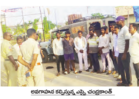
అవగాహన కలిగిస్తున్న ఎస్పీ చంద్రకాంత్

లింగాల, మే 8, ప్రభాతవార్త: విధిగా ప్రతి ఒక్కరూ రోడ్డు భద్రత నిబంధనలను పాటించి రోడ్డు ప్రమాదాలను నివారించాలని ఎస్పీ చంద్రకాంత్ సూచించారు. లింగాల పోలీస్ స్టేషన్ పరిధిలో ఆటో, జీప్ డ్రైవర్లతో అవగాహన కార్యక్రమాన్ని శుక్రవారం ఎన్ఐఎం. చంద్రకాంత్ నిర్వహించారు. ఈ సందర్భంగా ఆయన మాట్లాడుతూ వాహనదారులు తప్పనిసరిగా ట్రాఫిక్ నిబంధనలు పాటించాలని, మద్దం సేపిచి వాహనాలు నడపరాదని సూచించారు. అధిక ప్రయాణికులను ఎక్కించకూడదని, వేగ పరిమితిని పాటించి జాగ్రత్తగా వాహనాలు నడపాలని తెలిపారు. అలాగే డ్రైవింగ్ లైసెన్స్, వాహన పత్రాలను తప్పనిసరిగా వెంట ఉంచుకోవాలని, ప్రయాణికుల భద్రతకు ప్రాధాన్యత ఇవ్వాలని సూచించారు. రోడ్డు ప్రమాదాల నివారణలో ప్రతి డ్రైవర్ బాధ్యత వ్యవహరించాలని ఎన్ఐఎం చంద్రకాంత్ తెలిపారు. కార్యక్రమంలో పలువురు ఆటో, జీప్ డ్రైవర్లు పాల్గొన్నారు.